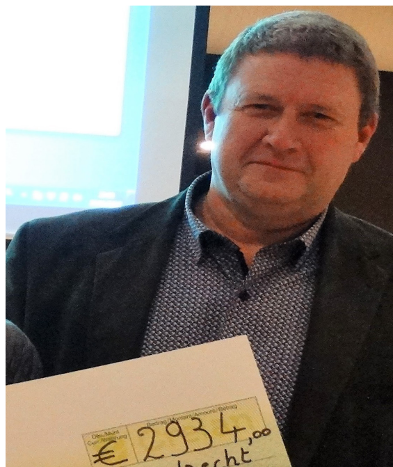
Vorig jaar ontving vzw Waaier, een vereniging begaan met het lot van (ex-)kankerpatiënten, een check van maar liefst 2.934 €. Dit jaar gaat de opbrengst van de sponsoring naar het Kinderkankerfonds, de check wordt traditiegetrouw afgegeven tijdens het Thanksgiving-diner op 22 november.

Ons volledig programma vind je op onze website zwijndrecht.n-va.be , of door de QR-code hiernaast te scannen.