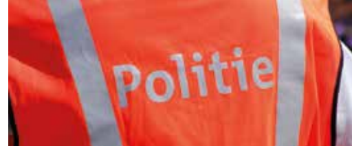
Fuseert Zwijndrechtse politiezone? p.3