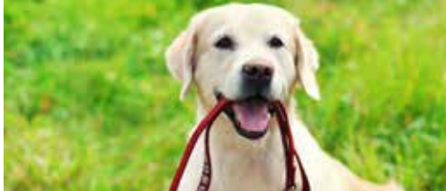
Honden niet toegelaten ... of toch? p.2